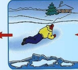
Проползти 3-4 метра по своим следам