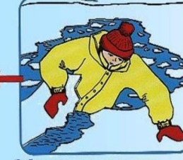
Забросить на лед ногу, откатиться от полыньи