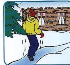
Не отдыхая, бежать к ближайшему жилью