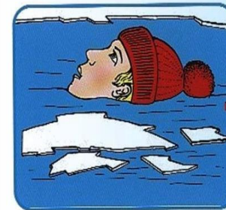
Не погружаться в воду с головой