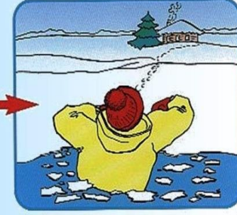
Выбираться в сторону, с которой произошло падение