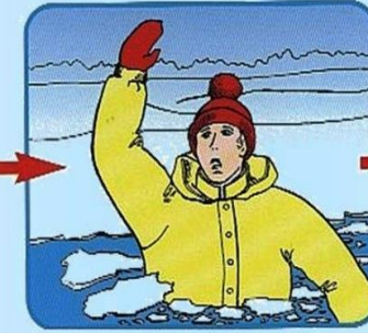
Не паниковать, позвать на помощь